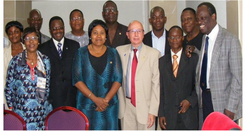
Réunion avec CORDE Ca MO Réunion avec Section Togolaise et Clubs Réunion avec les Comités d'Eau des Villages