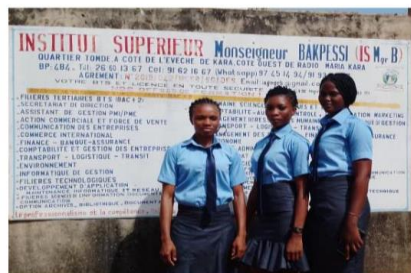
Photo des 3 Jeunes Filles en Uniforme