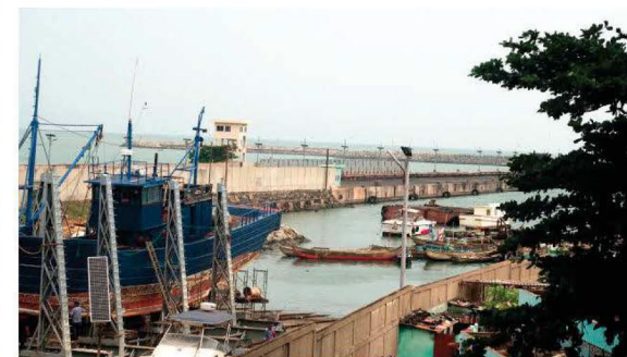
Le port de Cotonou est le poumon économique du Bénin. D'importants travaux sont prévus pour en faire une plateforme compétitive en Afrique de l'Ouest. Où seront demain les embarcations des pêcheurs ?

“ Peut-être devons-nous demander aux femmes, gardiennes de l'eau, du feu de la terre, de la vie... de faire offrande au crépuscule du reste de notre ferveur pour que demain ne soit pas sans lumière.