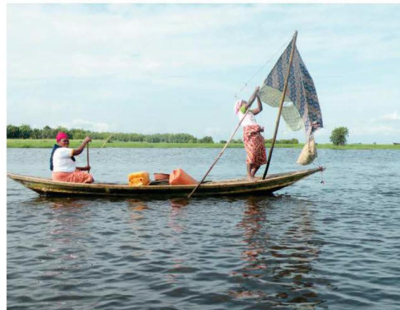
À Ganvié, village lacustre sur le lac Nokoué, tout se fait en barque.