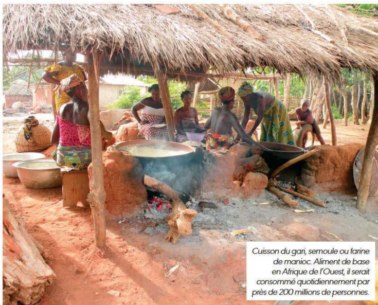
Cuisson du gari, semoule ou farine de manioc. Aliment de base en Afrique de l'Ouest, il serait consommé quotidiennement par près de 200 millions de personnes.

En avril 2007, à l'occasion d'un premier séjour humanitaire au Bénin, elle découvre les multiples facettes de ce pays d'Afrique de l'Ouest. Et s'éprend de cette terre et de ses habitants. Depuis, elle y retourne régulièrement et tente d'apporter de l'aide aux populations les plus démunies. Même si ce ne sont que des gouttes d'eau, elle persévère. Il y a encore tant à faire.