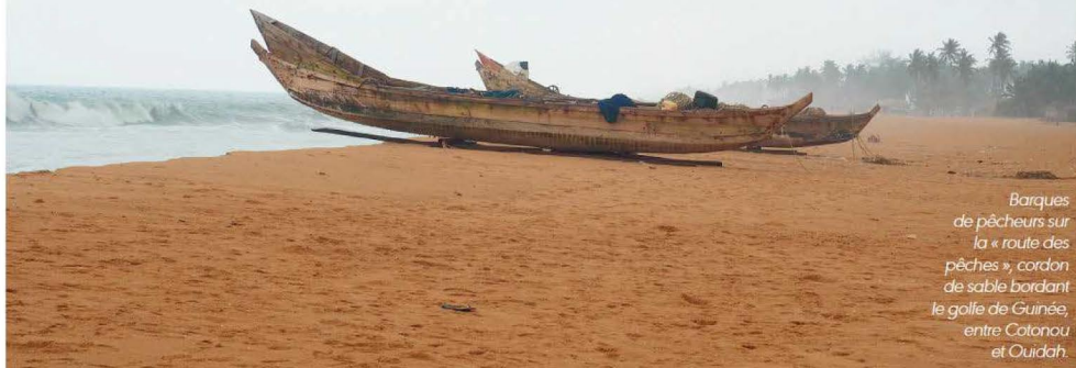
Barques de pêcheurs sur la « route des pêches », cordon de sable bordant le golfe de Guinée, entre Cotonou et Ouidah.