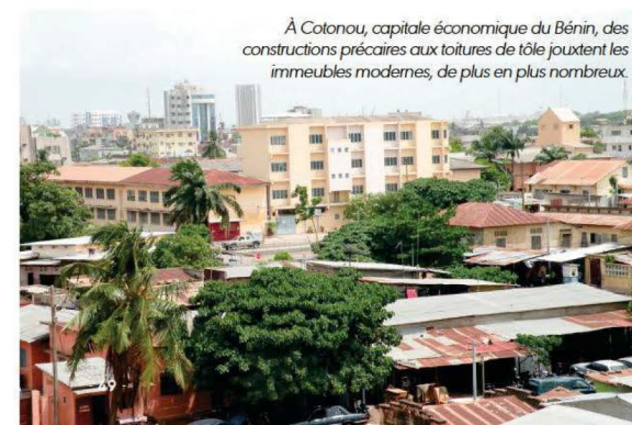
À Cotonou, capitale économique du Bénin, des constructions précaires aux toitures de tôle jouxtent les immeubles modernes, de plus en plus nombreux.