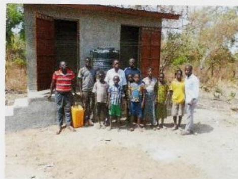
Photo d’1 ensemble de 2 Latrines