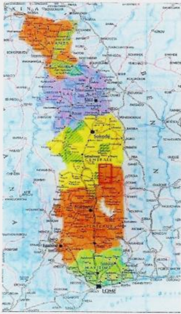
Carte TOGO avec Canton de Morétan dans le Rectangle Rouge.