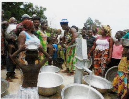
Photo d’1 forage

En 2010 , le taux de desserte d’Eau Potable était de 9,13 % pour 1 population de 30102 habitants. En fin de 2016 , il passe à 40,63 % pour 55989 habitants. En 2018 après les travaux d’extension , le taux passera à 44,05% pour 1 population prévue de 56189 habitants. Cette opération a été menée par l’ONG EAU SANS FRONTIERES aidée sur place par l’Association CORDECa Mo et de nombreux bailleurs de Fonds dont l’Agence de l’Eau Artois-Picardie – les Clubs Rotariens Français et Togolais – La Fondation Rotarienne – le CIP France-Togo .Quant à l’Assainissement , en 2010 le nombre d’ensembles de 2 latrines était de 15 dans les écoles et dans 1 état d’insalubrité élevée .En fin de 2016 , le Canton dispose de 22 ensembles de 2 latrines Sèches ECO-SAN dans les villages et de 20 dans les écoles primaires. Parallèlement 1 formation à l’Hygiène a été mise en place dans les écoles primaires.