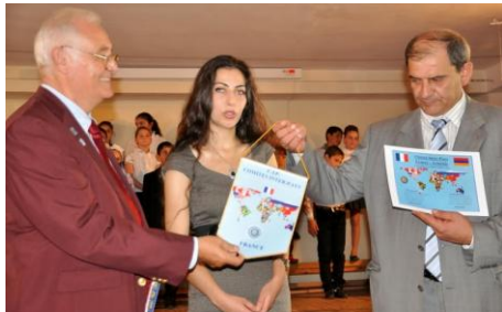
Echange de fanion

Lette remise de la charte de jumelage entre la section arménienne et la section française du CIP a eu lieu à l'école des arts de Gyumri le samedi 21 septembre à l'occasion de la venue de membres du bureau de la section française en Arménie.