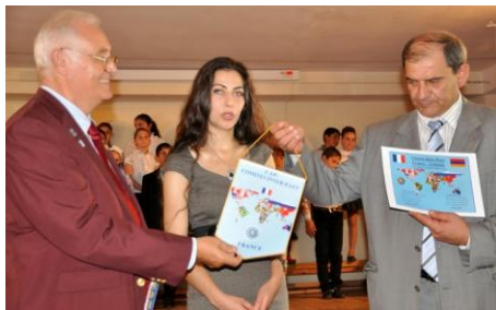
Echange de fanions

La remise de la charte de jumelage entre la section arménienne et la section française du CIP a eu lieu à l'école des arts de Gyumri le samedi 21 septembre 2013 à l'occasion de la venue de membres du bureau de la section française en Arménie.