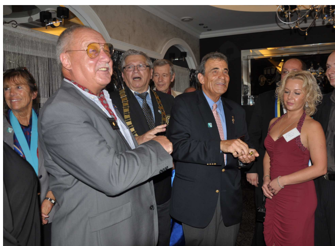
Exercice très périlleux, accrocher les insignes aux jeunes rotariennes !!!.