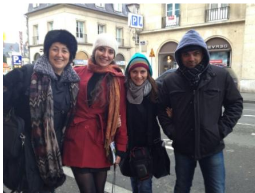
EGE en France