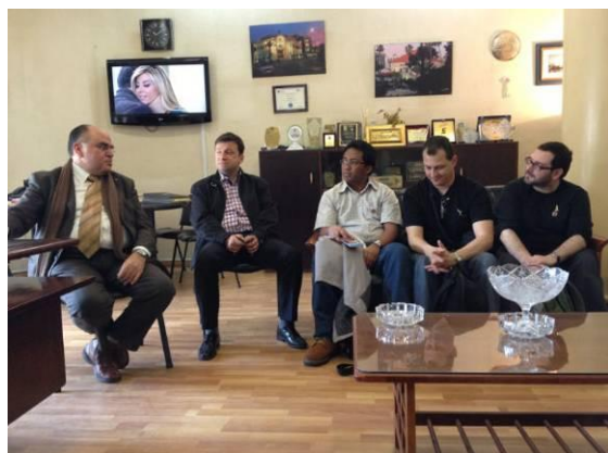
EGE au Liban