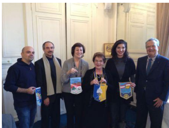
EGE en France