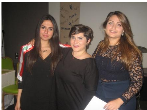
Libanaises au RYLA 1750 sud