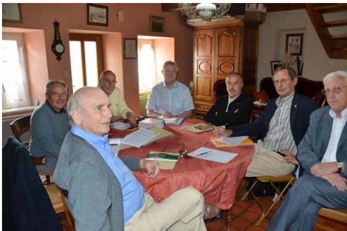
En réunion, la pose pour la traditionnelle photo