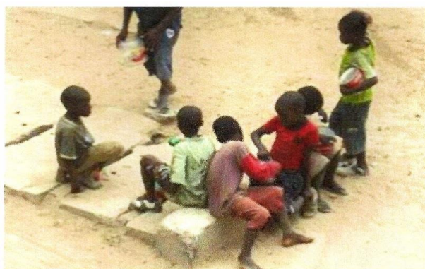
Les Enfants de la rue de Lomé