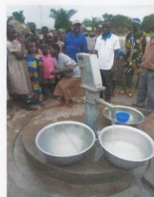
Photo d'1 Forage