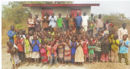
Photo d'1 Ensemble de 2 Latrines avec Réservoir d'Eau